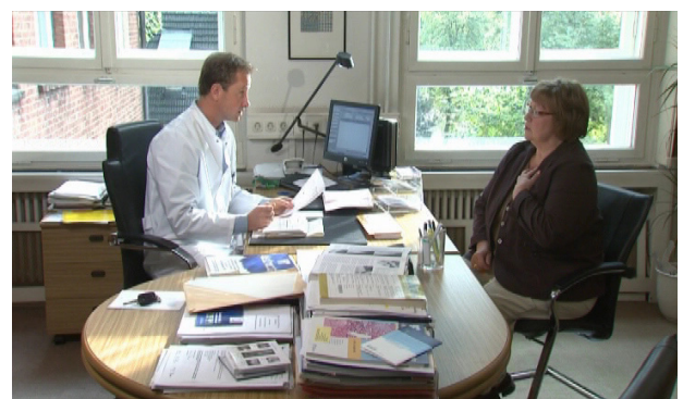
Szene aus dem Video

steht. Das Verständnis für die Notwendigkeit zur Lebensänderung wird geschärft, indem die medizinischen Zusammenhänge bis hin zu den Folgeschäden vermittelt werden. Der Blick ins Innere der Patienten, die gerade mit der Diagnose konfrontiert wurden, sorgt für Identifikation mit den Protagonisten und damit Motivation zur Lebensumstellung. „Lifestyle Change“ bedeutet mehr, als einfach ein paar Medikamente einzunehmen. Mit der richtigen Unterstützung ist Diabetes Typ 2 aber genau durch diese Umstellung in den Griff zu bekommen.